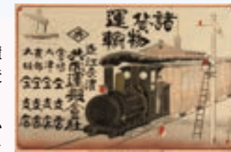
近江長濱 共同搬運會社宣傳單

明治4年（1871年）縣內第一所小學成立，明治10年（1877年）國立銀行成立。明治15年（1882年）鐵路開通，與此同時，鐵路聯絡船開始在琵琶湖運行，長濱演變為近代的重要交通樞紐。郡政府以及郵局等現代化公共設施，也相繼得到完善，長濱發生了令人矚目的變化。