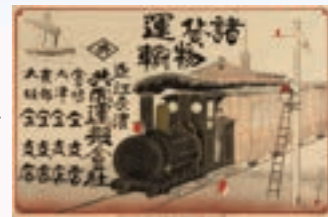
近江長浜 共同運搬会社引き札

明治4年(1871)には県下初の小学校が創立され、明治10年(1877)には国立銀行が設けられました。明治15年(1882)に鉄道が開通し、さらにそれにとまって琵琶湖を鉄道連絡船が運航することにより、長浜は近代交通の要所となりました。郡役所や郵便局などの近代的な公共施設もあいついで整備され、長浜はめざましい変貌をとげていきました。